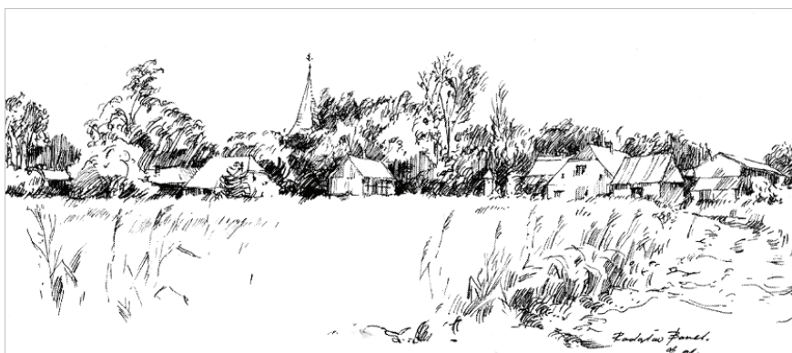
Ryc. 4. Panorama Łącka od strony południowej. Rys. R. Barek

Wieś Łącko zlokalizowana jest w Nadmorskim Obszarze Krajobrazu Chronionego w pasie pobraża na zachód od Ustki, w gminie Postomino, powiat Sławno (ryc. 4). Piękno tej lokalizacji widoczne jest również z pobliskiego jeziora Wicko. Łącko i okoliczne wsie leżą w regionie, gdzie dominującą formą zabudowy było tradycyjne budownictwo szachulcowe (ryc. 5). Region określany jest obecnie mianem „Krainy w kratę” (np. Szalewska 2002). Łącko posiada około trzydziestu zachowanych obiektów zbudowanych w tej technice szachulcowej (Tabl. I: A; ryc. 6–7).