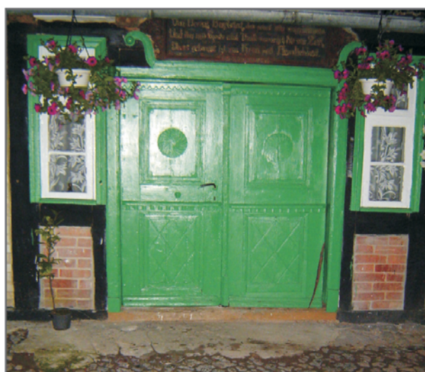
B. Odremontowane główne wejście do budynku mieszkalnego nr 20 w Łącku. Fot. R. Berek, lipiec 2004