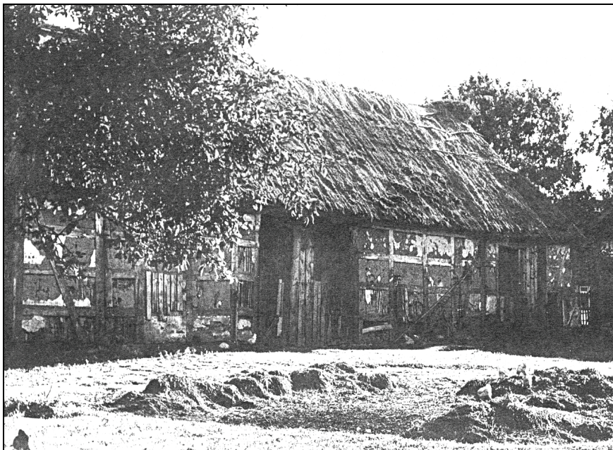
Ryc. 2. Nieistniejąca już stodoła w zagrodzie nr 18 w Łącku. Zdjęcie z lat 70. XX wieku