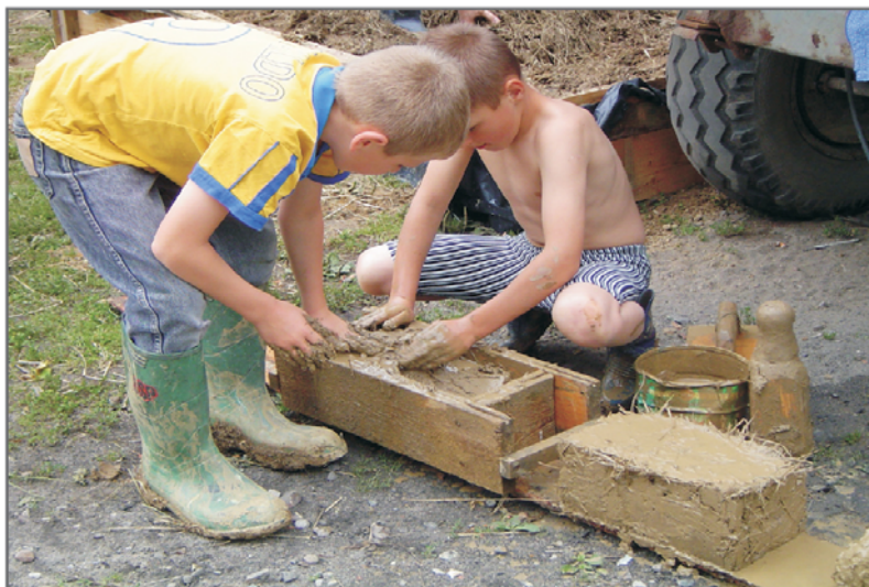
A. Formowanie cegieł przed etapem wypełniania ścian.