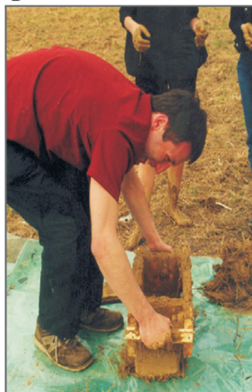
A, B, C, D. Przygotowywanie gliny do wytwarzania cegieł.