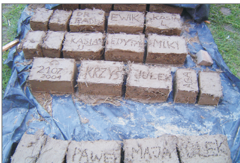
B. Suszenie cegieł przed etapem wypełniania ścian.