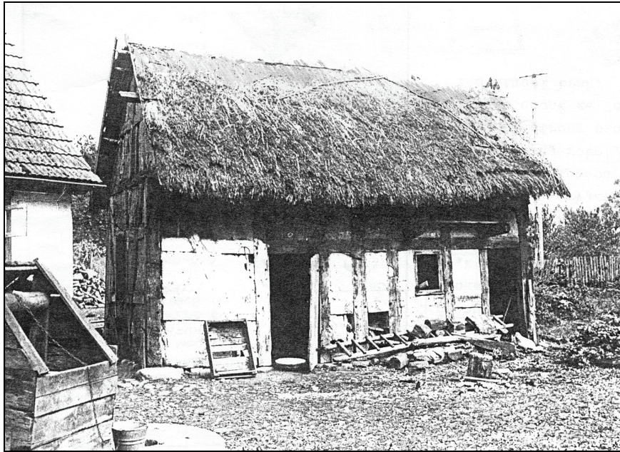
Ryc. 3. Nieistniejący już kurnik w zagrodzie nr 58. Zdjęcie z lat 70. XX wieku

go typu dziedzictwa kulturowego, ale przede wszystkim brak wśród mieszkańców praktycznej umiejętności remontowania i budowania z zastosowaniem techniki budownictwa szachulcowego. Zasady tej techniki poznawane były najczęściej w procesie rozbiórki zniszczonych zabudowań.