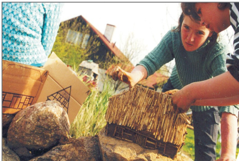
A. Lepienie makiet z gliny według autentycznych wzorów istniejących jeszcze w Łącku domów.