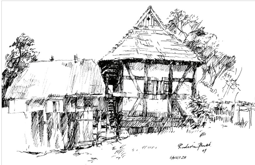
Ryc. 7. Budynek gospodarczy w zagrodzie nr 26. Rys. R. Barek

twem oraz kształcenie wśród młodzieży i dzieci zamiłowania do lokalnego dziedzictwa kulturowego. Założenia projektu obejmują realizację cyklu działań: