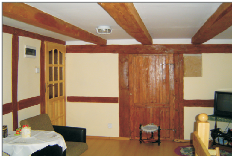
A. Wnętrze jednego z pomieszczeń z wyeksponowaniem oryginalnego fragmentu ściany z gliny. Fot. R. Berek, lipiec 2004