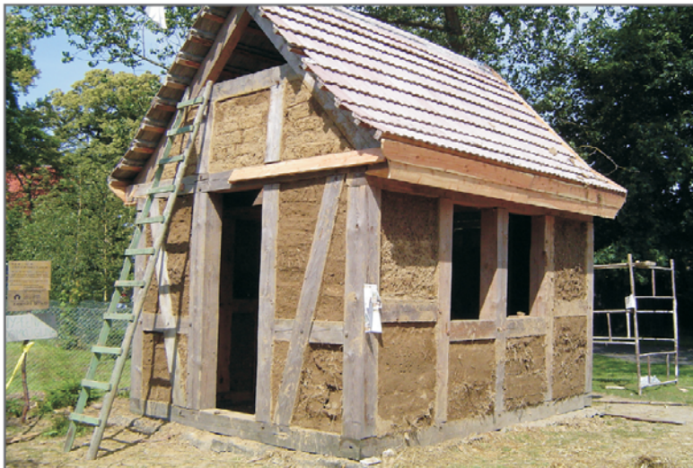
A. Domek - ekspozycja konstrukcji szachulcowej. Fot. R. Berek, lipiec 2004