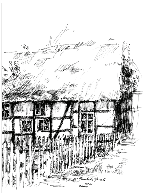
Ryc. 6. Budynek mieszkalny w zagrodzie nr 55. Rys. R. Berek