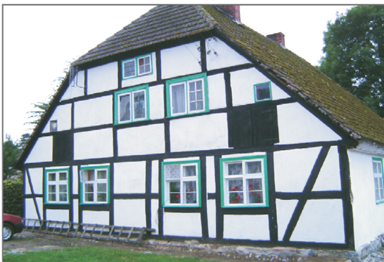
B. Odremontowana elewacja domu nr 20 w Łącku. lipiec 2004