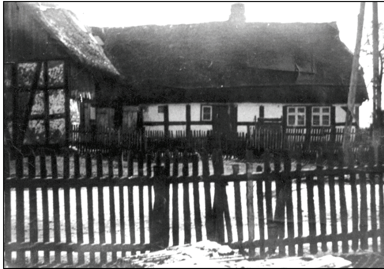
Ryc. 1. Nieistniejący już dom nr 6 w Łącku. Zdjęcie z lat 70. XX wieku